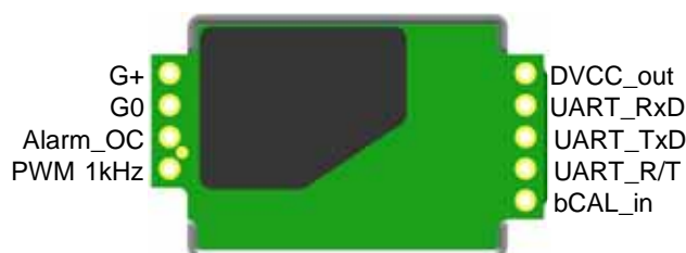
Figure 2: ピンアサインメント