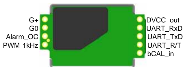
Figure 2: ピンアサインメント