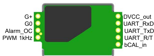
Figure 2: ピンアサインメント